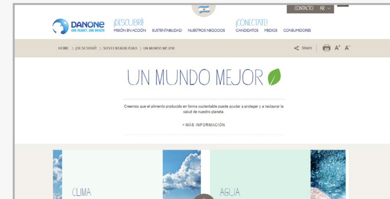
DANONE Pagina Corporativa