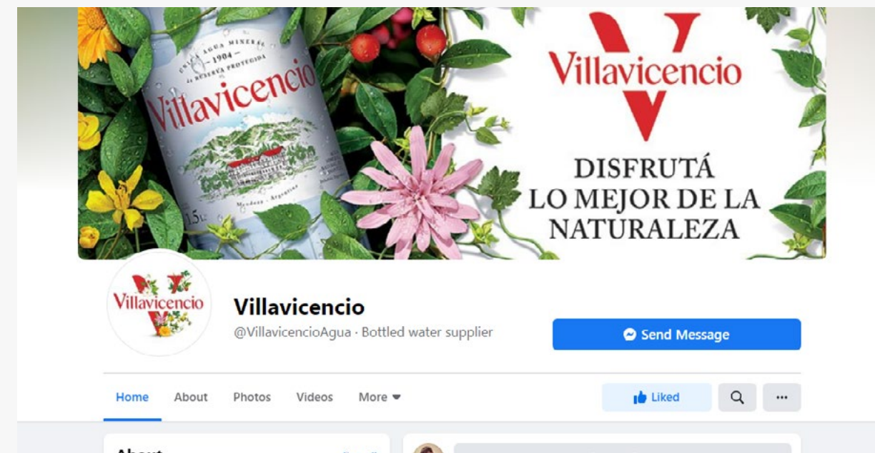
VILLAVICENCIO Facebook fan page